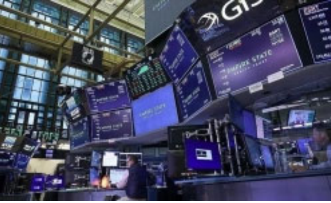
Küresel piyasalarda son durum: Belirsizlik sürüyor