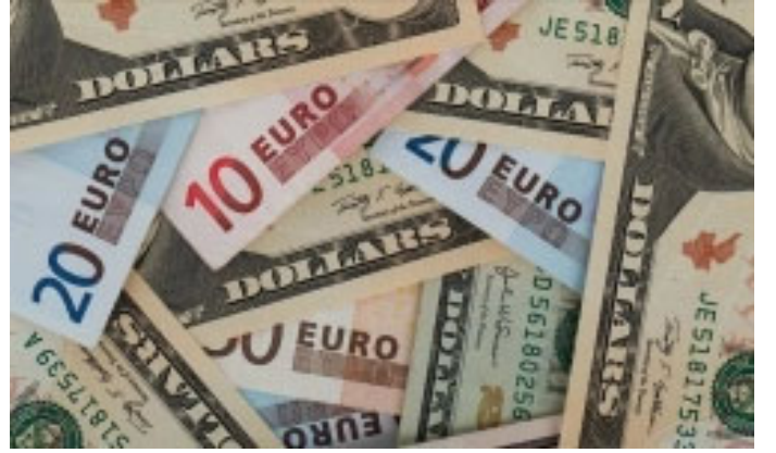
Dolar ve euro artmaya devam ediyor