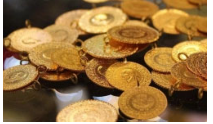
Altın yükselişini sürdürüyor