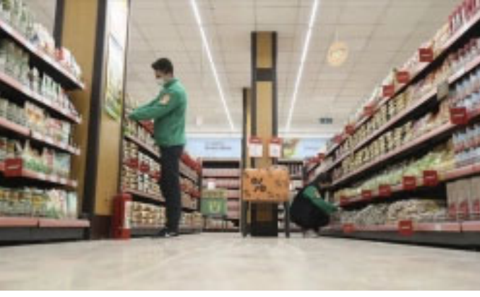
Tarım Kredi Kooperatif marketleri sabit fiyat kampanyasını 1 ay uzattı