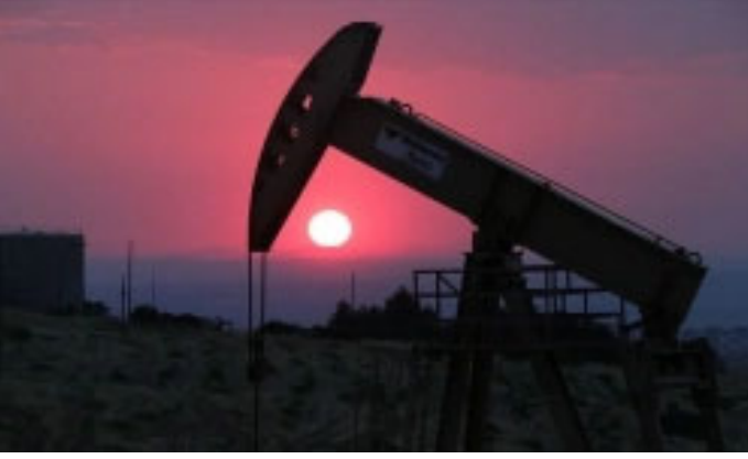
Brent petrolün varili 85,07 dolardan alıcı buluyor