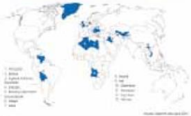
Şekil 1. Gazprom'un Rusya'daki Enerji Üretim Üstünlük Alanları Haritası (2024)

Rusya'nın enerji arz güvenliğinde önemli roller oynamaktadır. Özellikle Orta Doğu ve Akdeniz bölgeleri enerji arz güvenliğinde önemli roller oynamaktadır. Özellikle Orta Doğu ve Akdeniz bölgeleri enerji arz güvenliğinde önemli roller oynamaktadır. Özellikle Orta Doğu ve Akdeniz bölgeleri enerji arz güvenliğinde önemli roller oynamaktadır. Özellikle Orta Doğu ve Akdeniz bölgeleri enerji arz güvenliğinde önemli roller oynamaktadır.