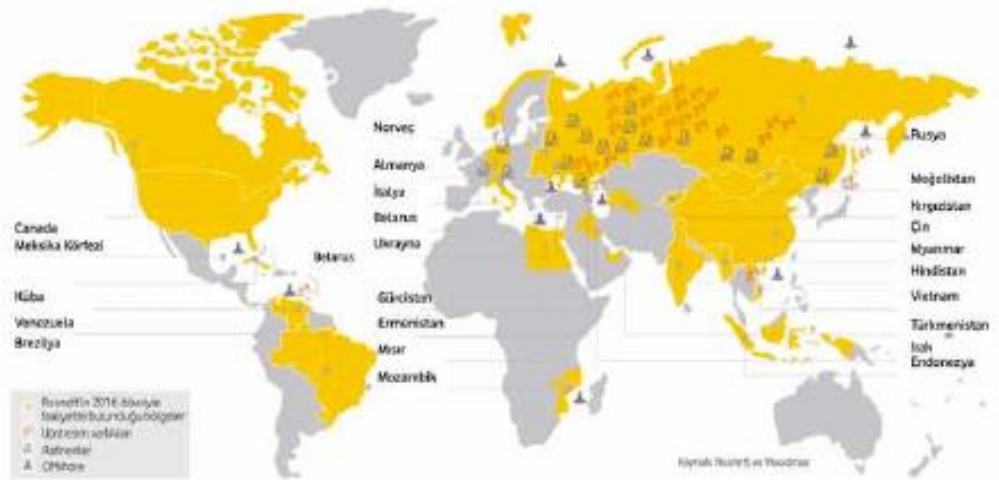
Şekil 4: Rosneft'in Rusya dışında çalıştığı ülkeler.

Yine burada göze önünde bulundurulması önemli nokta, bölgedeki rezervleri elde tutabilmek için söz konusu beş blok'un tahmini alınabilir rezervinin 670 milyon varil olduğu düşünülmektedir, ayrıca boru hattını kontrol ederek hem Türkiye'nin enerji merkezi olma durumunu hem de Kuzey Irak'tan ihraç edilen petrolün ve doğalgazın kontrolünü sağlayabilmektedir. Ülkelerin en önemli stratejik konuları enerji hammaddesi güvenliğidir. Rusya da bu konuda işini yarı bırakmayan stratejiler geliştirerek sıcak denizlere inme hayalini bölgenin petrol ve doğalgaz kaynaklarını elinde tutarak